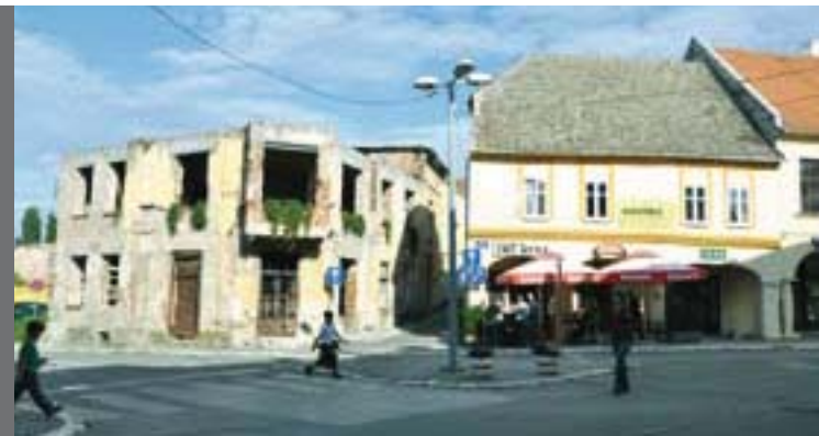
Die Region um Vukovar war während des Kroatien-Kriegs 1991 bis 1995 das am stärksten umkämpfte Gebiet. Noch sind nicht alle Kriegsschäden beseitigt.