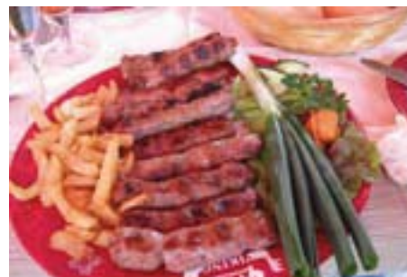
Serbische Spezialitäten, auch bei uns nicht unbekannt, schmeckten vor Ort natürlich noch besser.