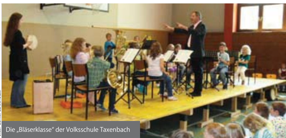
Die „Bläserklasse“ der Volksschule Taxenbach