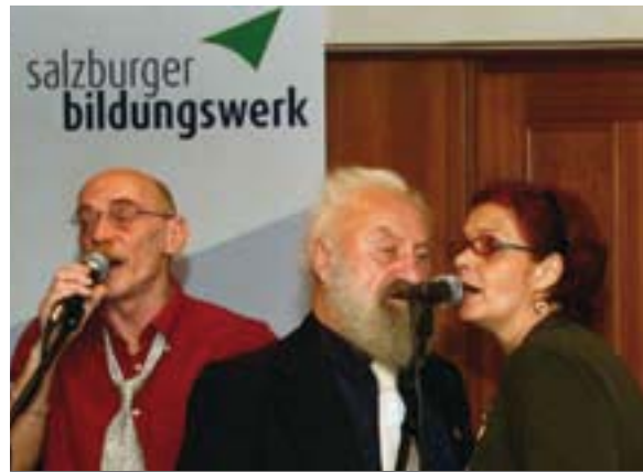
Die Wiener Vokalgruppe „Stimmgewitter Augustin“.