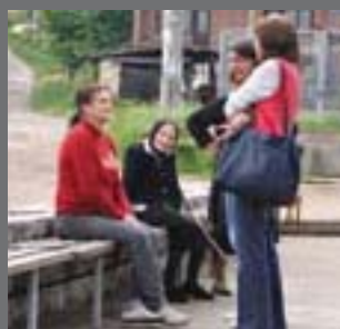
Immer wieder kam es zu Begegnungen – hier im dünnbesiedelten Osten Serbiens. Und immer wieder fanden sich „DolmetscherInnen“, die jüngere Dame hatte bis vor kurzem in einem Salzburger Hotel gearbeitet.