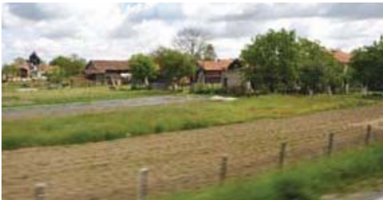
Durch die Kornkammer Kroatiens, Slawonien, führte die Reise vom slowenischen Ptuj, nach Vukovar.