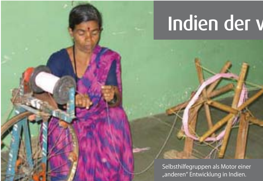
Selbsthilfegruppen als Motor einer „anderen“ Entwicklung in Indien.