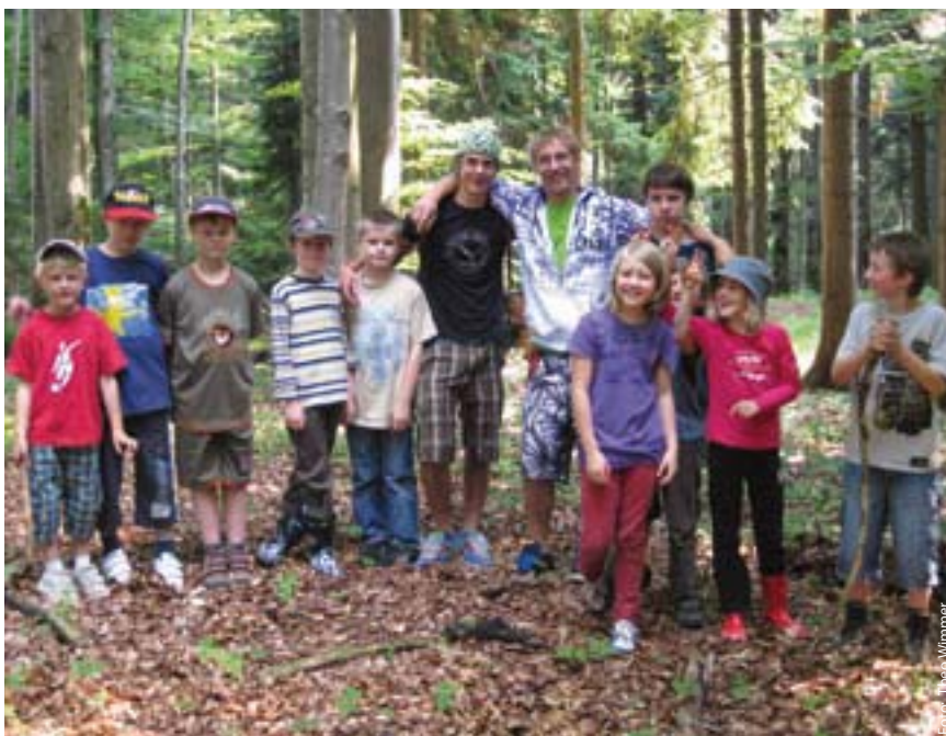
Wald & Wiesn-Gaudi