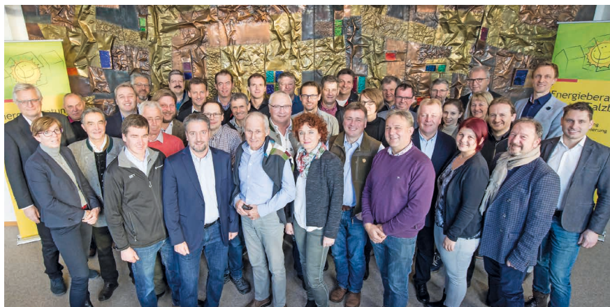
Team der Energieberatung Salzburg.

Das Ziel jeder Beratung ist es, Schritt für Schritt zur optimalen Energiekosteneinsparung zu gelangen.